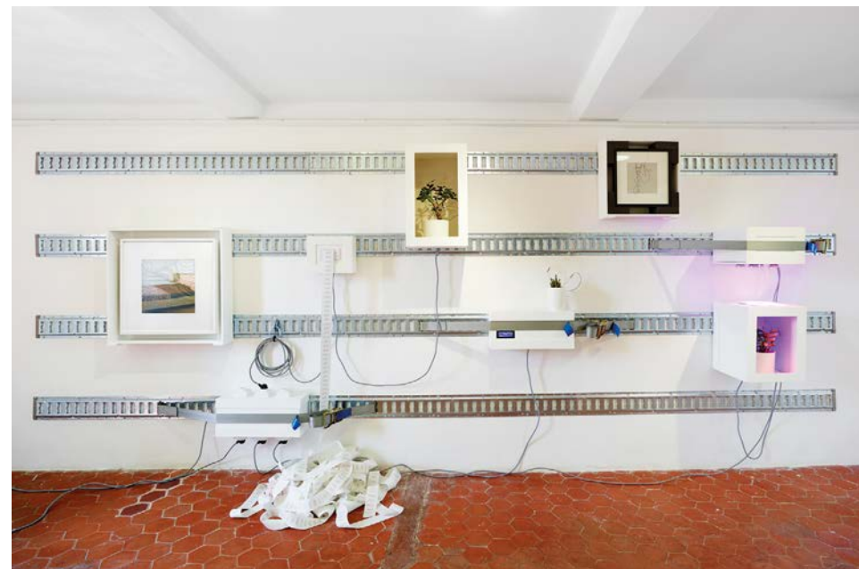
© Arrimage #080717 (2017) composition sur rails d'arrimage dimensions variables (ici: 200 x 450 x 35 cm)

Galerie G - rdc Complexe Gérard Philippe - rue Charles Sandro - La Garde / mardis, mercredis & vendredis 10h-12h & 14h-17h30, samedis 9h-13h sauf jours fériés f GalerieG - service culturel : 04 94 08 99 19 / lagalerieg@ville-lagarde.fr / accueil Galerie G : 04 94 08 99 68