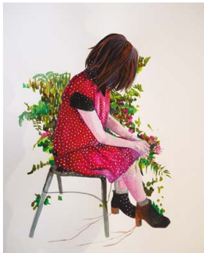
© Série «Esperan» - 75cmx65cm - aquarelle

Exposition jusqu'au 7 avril cabezaspizarro@orange.fr https://cabezaspizarro.wixsite.com/silviacabezaspizarro