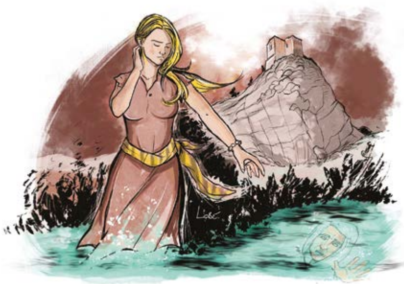
Illustration par Lobé bd « Pays toulonnais, La Garde... cité du Rocher tome 1 » Lobé et A. Graïseyl, ed. Prestance.