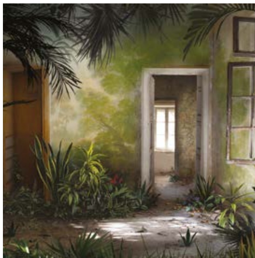
© Hothouse (extrait) : photographie, impression pigmentaire sur papier Hahnemühle, édition de 15, 101 x 121cm, 2019

L'œuvre est élaborée à partir d'une multitude d'images parcellaires et diverses, anciennes ou modernes, de grands décors à de minuscules détails, glanées et collectées par l'artiste. Elle va ensuite mettre en scène ce matériel de papier sur des plaques de verres. Cela donne naissance à des petits décors théâtraux qui seront ensuite photographiés et retravaillés numériquement. L'artiste initie alors une œuvre totale, déconstruisant et recréant de nouveaux repères. Le référant au réel, par l'extrême précision des images utilisées, bascule très vite dans un univers onirique et énigmatique où les codes de la représentation mimétique sont transgressés. Suzanne Moxhay réinvente le langage photographique. Véritable tremplin à l'imaginaire, elle s'éloigne du sens premier des images et développe une narration fantastique. Suzanne Moxhay va déployer sciemment des incohérences, des anomalies de lumière, de perspective, d'échelle, rendant son image encore plus séduisante et pénétrante.