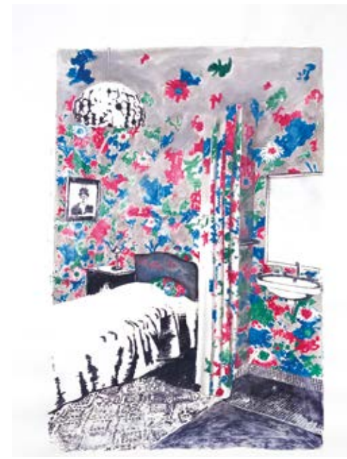
© Sans titre, série les intérieurs, technique mixte sur velin d'arches, 120 x 80 cm, 2015