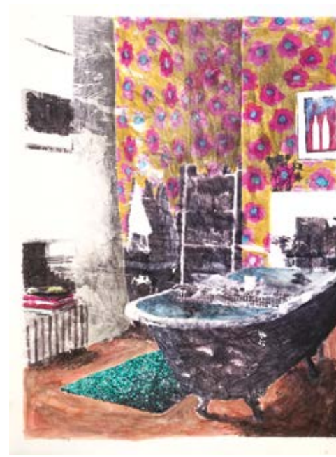
© Sans titre, série les intérieurs, technique mixte sur velin d'arches, 65 x 50 cm, 2019