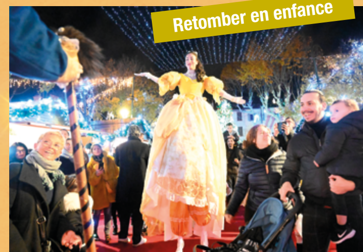
Retomber en enfance