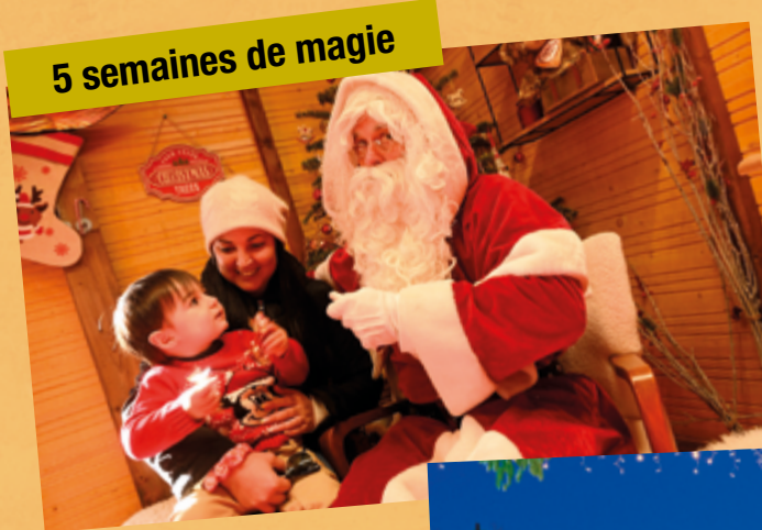
5 semaines de magie