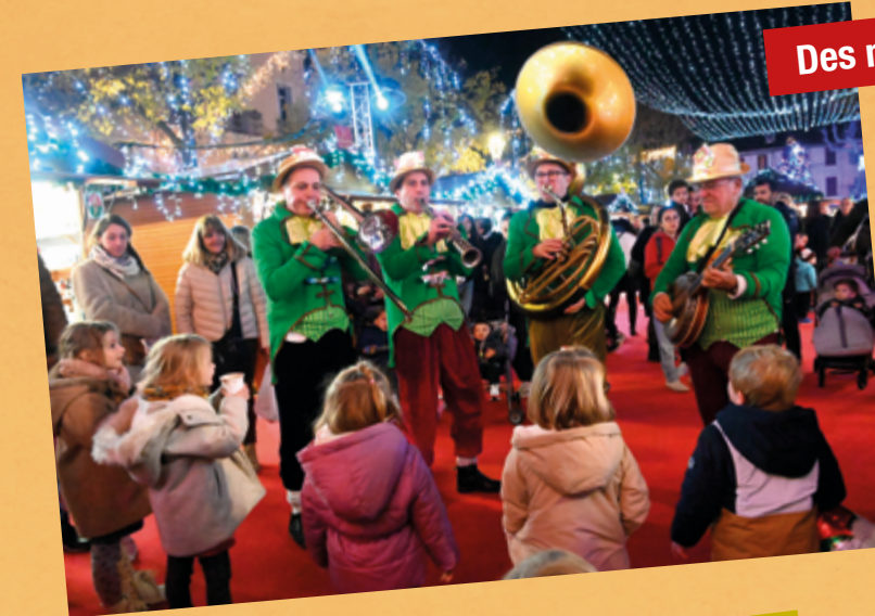
Des moments d'émerveillement

Un grand merci d'avoir été si nombreux à venir vivre des moments magiques sur le plus beau village de Noël du Sud de la France