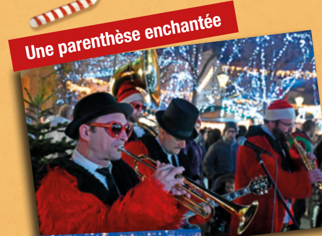
Une parenthèse enchantée