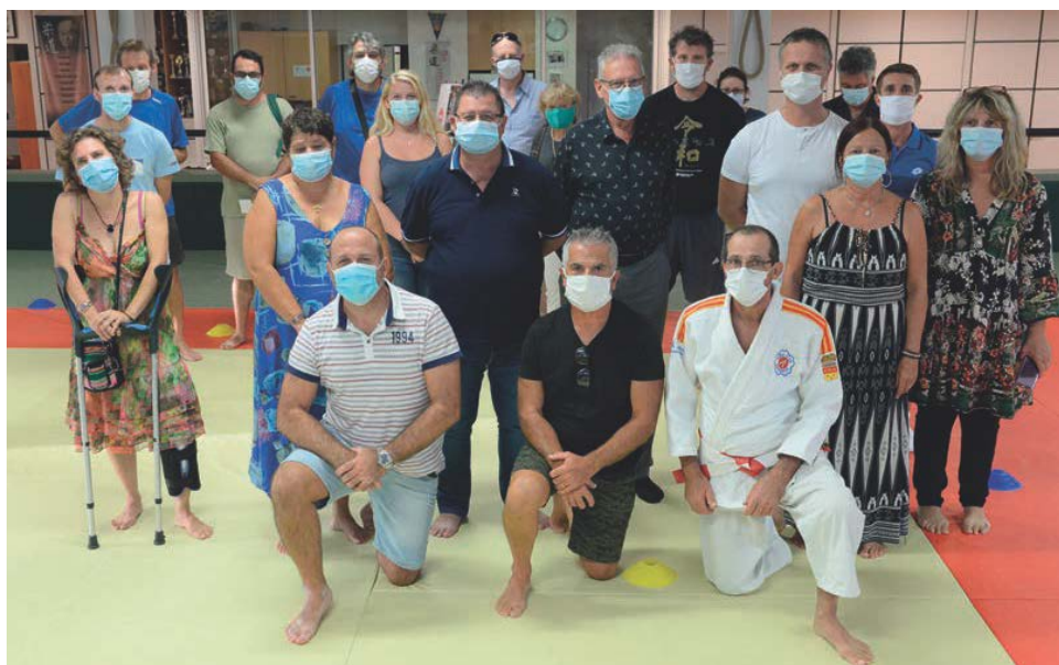
Les membres du conseil d'administration du JCG.