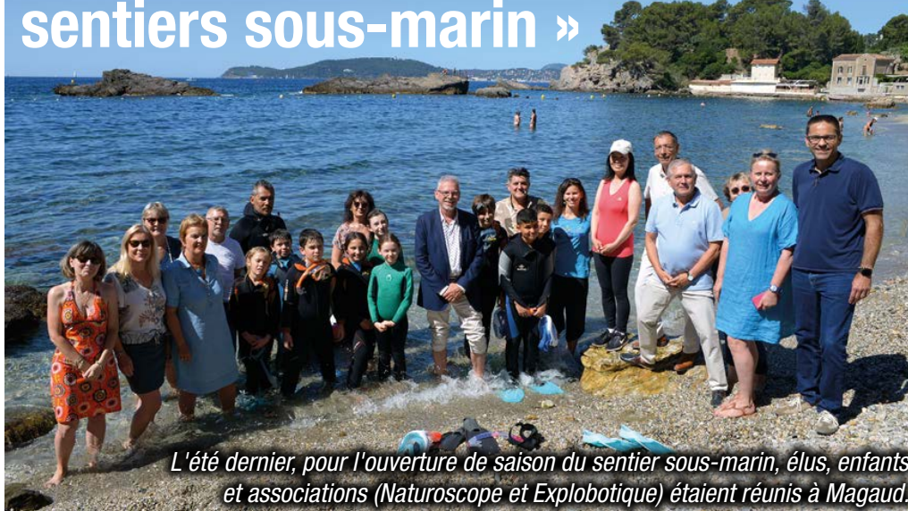
L'été dernier, pour l'ouverture de saison du sentier sous-marin, élus, enfants et associations (Naturoscope et Explobotique) étaient réunis à Magaud.

Le sentier sous-marin de l'anse Magaud est partenaire du Parc national de Port-Cros. Il offre une découverte accessible à tous du monde marin. La Ville de La Garde a renouvelé son partenariat avec deux associations qui font partager aux enfants et au grand public, leur amour de la mer.